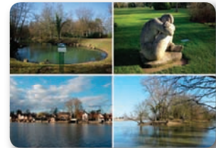
Le Loiret, entre sa source (Orléans-45), ZPPAUP, et sa confluence avec la Loire (St-Pryvé-St-Mesmin-45)