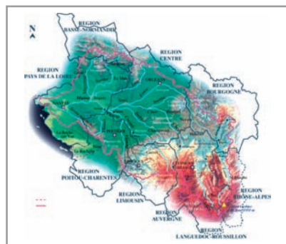
Bassin du fleuve Loire et fleuves côtiers associés