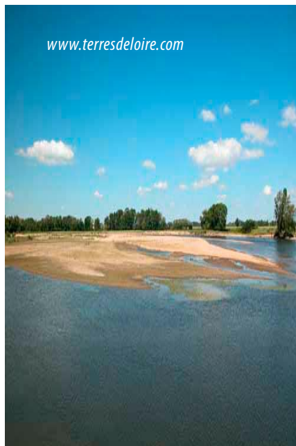
Un site départemental d'Interprétation en Loire bourbonnaise : Le site naturel de Fleury, méandre de Loire à Bourbon-Lancy-71 (Saône-et-Loire en Région Bourgogne)