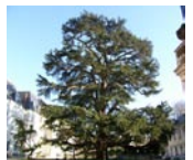
Cèdre du Liban