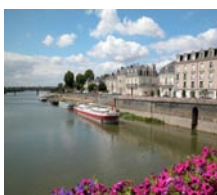
La Maine à Angers-49