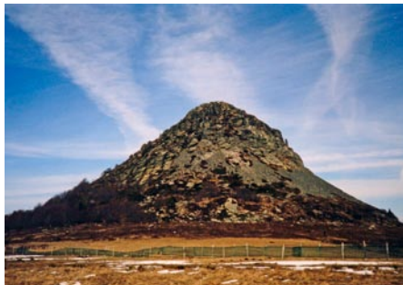
Sources de la Loire : Mont Gerbier de Jonc à Ste-Eulalie-07 (Ardèche en Rhône-Alpes)