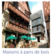
Maisons à pans de bois

Une des conclusions du colloque organisé en décembre 2006 à l'occasion du centenaire de la loi 1906 sur la protection des paysages , retranscrite dans l'Editorial de M. Jacques ZEIMERT, Président de l'Association Sauvegarde de la Loire Angevine dans sa Lettre d'information N°42 (déc. 2006). Celui-ci y rapporte les propos de l'intervention du Sénateur Yves DAUGE : «Une politique de protection vigoureuse avec le classement, c'est bien, mais je m'inquiète pour les espaces non protégés, situés entre les grands sites, car ils se dégradent de plus en plus rapidement. Il va falloir faire quelque chose, il faut y réfléchir». M. ZEIMERT souligne là qu'il s'agit d'une «parole de Sage qui ne peut laisser indifférent. Les communes, maîtresses de l'utilisation des sols, disposent d'une palette d'outils réglementaires suffisantes pour gérer ces «paysages du quotidien» mais il faut la volonté politique de le faire. La Commission départementale des sites et paysages pourrait jouer ce rôle d'incitation.»