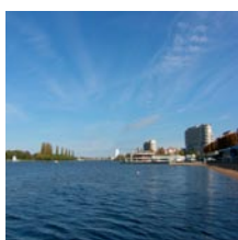
L'Allier à Vichy-03