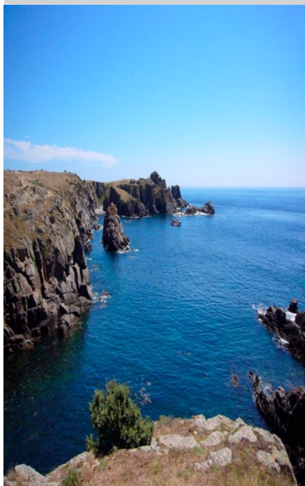
L'Océan Atlantique : Côte rocheuse près du Port de la Meule à L'Île d'Yeu-85 (Vendée en Pays de la Loire)

Organiser les données sur les sites et paysages pour rendre possible une gestion fine et cohérente de ces biens communs :