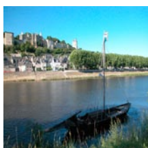
La Vienne à Chinon-37